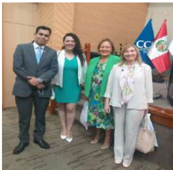
El día de la mujer en Cámara de Comercio