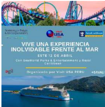
Seaword Park – Royal Caribbean