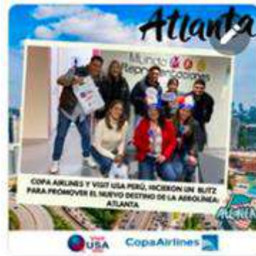
Visita con Atlanta