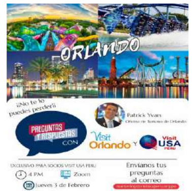
Seminario Virtual Orlando