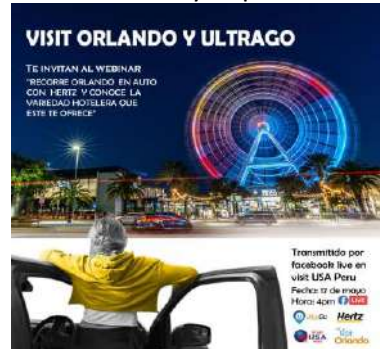
Visit Orlando y Ultrago