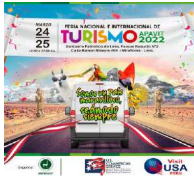
Feria de Turismo