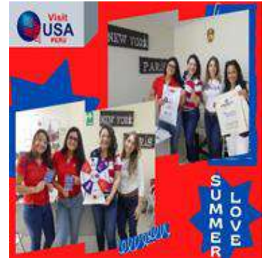
Visita con Atlanta