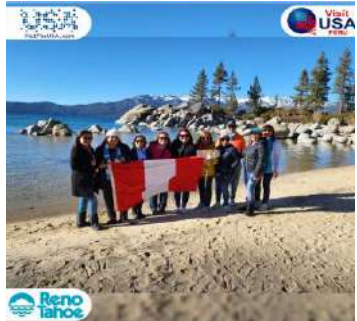
Lake Tahoe – Reno Nevada