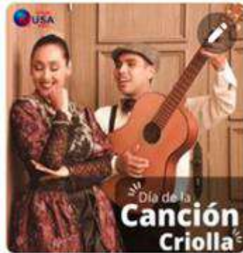
Dia de la canción Criolla