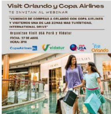
Visit Orlando y Copa Airlines